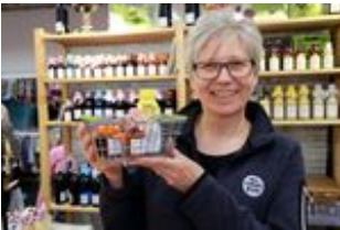
2018 creativa 226.jpg 355 KB