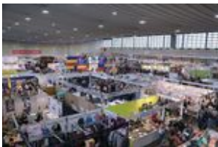
2018 creativa 174.jpg Gefüllte Messehallen der CREATIVA 2018 606 KB