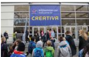
2018 creativa 203.jpg Besucher am Eingang der CREATIVA 431 KB