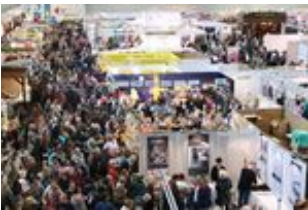
2018 creativa 230.jpg Gut besuchte Messehallen 590 KB