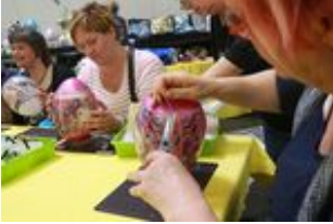
2017 creativa 018.jpg

Die große Anzahl an Workshops ist ein beliebtes Markenzeichen der CREATIVA.