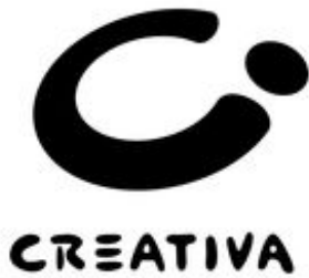
CREATIVA Logo schwarz/weiss 627 KB