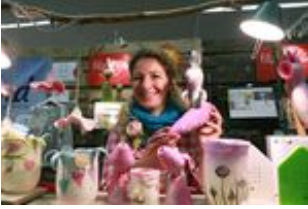
2018 creativa 221.jpg 333 KB