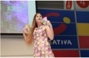
2017 creativa 186.jpg

Die Modenschauen in Halle 4 brachten auch ungewöhnliche Kleidung auf den Laufsteg.