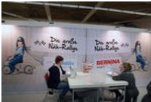
2018 creativa 089.jpg Die große Näh-Rallye im Rahmen der CREATIVA. 272 KB