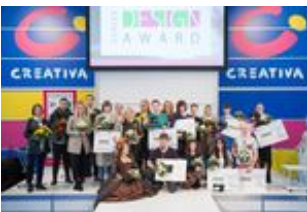
Sieger DORTEX Design-Award.jpg

Die Sieger des DORTEX Design-Awards 2018.