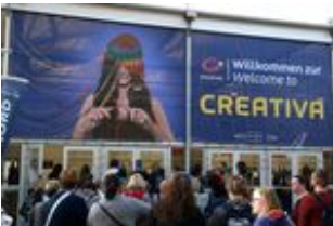
2017 creativa 269.jpg

Der Messeingang Nord während der CREATIVA.