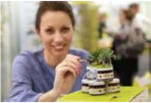
2018 creativa 222.jpg An vielen Ausstellerständen lockten die verschiedensten Workshops, wie hier bei dem Unternehmen NOCH. 270 KB