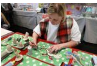
2018 creativa 217.jpg 404 KB