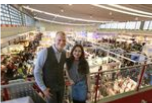
2017 creativa 362.jpg