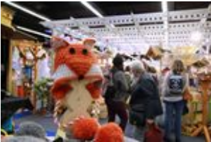
2018 creativa 223.jpg 331 KB