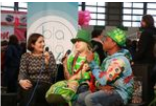
2018 creativa 241.jpg 389 KB