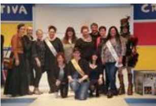
2017 cakequeen gruppe.jpg

Queens'-Battle: Gruppenbild aller Wettbewerbsteilnehmerinnen und -siegerinnen