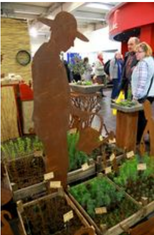
2017 creativa 361.jpg

Der LandGarten im Rahmen der CREATIVA ist der Marktplatz für Gartenkultur und ländliche Lebensart.