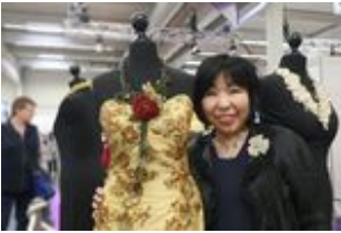
2017 creativa 037.jpg

Die PerlenExpo zeigte das ganze Spektrum der Perlenkunst, unter anderem mit der japanischen Künstlerin Misako Kishi.