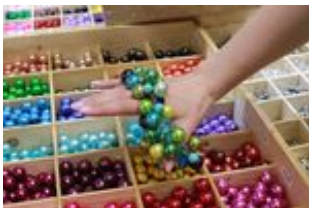
2018 creativa 213.jpg Auch in diesem Jahr waren Perlen wieder sehr gefragt. Die Besucher fanden in der Themenwelt der PerlenExpo, alles, was das Perlenherz begehrt. 355 KB