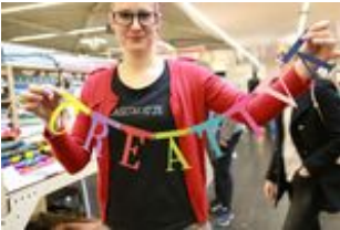
2018 creativa 300.jpg