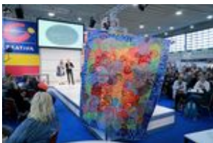
2018 creativa 178.jpg