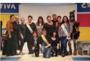
2017 cakequeen gruppe.jpg

Queens'-Battle: Gruppenbild aller Wettbewerbsteilnehmerinnen und -siegerinnen