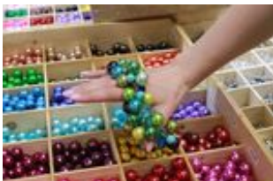
2018 creativa 213.jpg

Auch in diesem Jahr waren Perlen wieder sehr gefragt. Die Besucher fanden in der Themenwelt der PerlenExpo, alles, was das Perlenherz begehrt.