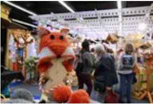
2018 creativa 223.jpg 331 KB