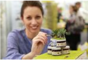
2018 creativa 222.jpg An vielen Ausstellerständen lockten die verschiedensten Workshops, wie hier bei dem Unternehmen NOCH. 270 KB