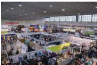
2018 creativa 174.jpg