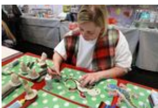
2018 creativa 217.jpg