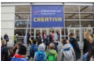
2018 creativa 203.jpg